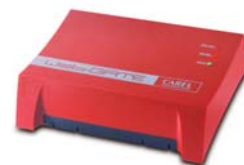
Carel WebGate – универсальный аппаратный веб-сервер

SCADA – это аббревиатура от слов Supervisory Control And Data Acquisition (диспетчерское управление и сбор данных). SCADA представляет собой программное обеспечение, выполняющее следующие функции: