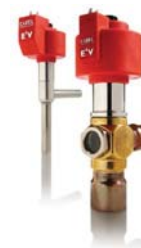
Электронные ТРВ Carel для холодильных машин малой и большой мощности