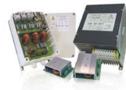
ШИМ регуляторы Carel для управления скоростью вращения вентиляторов

Для климатического оборудования, использующего фреоновые охладители, Carel предлагает электронные терморасширительные вентили (ТРВ) и необходимые для управления ими аппаратные драйверы. При использовании электронных ТРВ экономия энергии применительно к торговому холодильному оборудованию может составлять до 30% на установку.