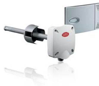
Датчики температуры и влажности Carel в канальном и настенном исполнении

Carel поставляет датчики температуры и влажности воздуха, наличия вредных примесей, давления теплоносителя, а также дифманометры. При этом варианты исполнения датчиков позволяют использовать их в самых разных условиях – в помещениях, на улице, в воздуховодах, на трубах, по которым подается теплоноситель. Для снижения риска выхода из строя водяных теплообменников в зимних условиях предлагаются капиллярные термостаты, средства защиты электродвигателей и многое другое.