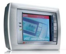
Пользовательский терминал с сенсорным экраном rGD 3

Для бытовых и офисных помещений существует беспроводная система управления климатическим оборудованием EasyWay. Пульт управления такой системы может быть расположен непосредственно на рабочем месте сотрудника в офисе или в удобном месте дома. Измерение уровня температуры и влажности, которые должна поддерживать система вентиляции и кондиционирования, осуществляется самим беспроводным пультом. В результате указанные параметры обеспечиваются именно там, где это более всего необходимо.