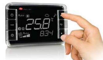
Беспроводной пульт управления системы EasyWay