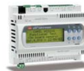
Свободнопрограммируемый контроллер семейства рСО XS