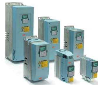
Частотные преобразователи Carel