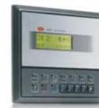
тАС – контроллер для управления прецизионными кондиционерами