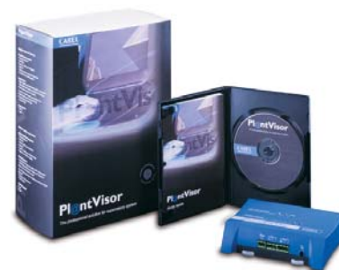
PlantVisor – программное обеспечение для построения систем диспетчеризации инженерного оборудования