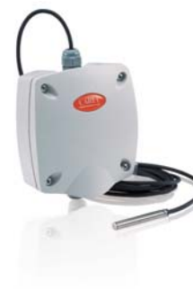
Датчик температуры Carel в исполнении для наружного применения