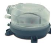
Дифференциальный манометр Carel