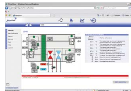
Carel PlantVisor – вид экрана