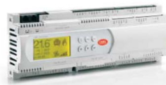
Свободнопрограммируемый контроллер семейства рСО 3

Программирование контроллеров указанных семейств осуществляется при помощи специального программного обеспечения Carel EasyTools. EasyTools включает в себя большое количество готовых примеров программ для систем управления чиллерами, центральными кондиционерами, приточными установками и другим климатическим оборудованием. Наличие подобных примеров существенно упрощает освоение контроллеров семейства рСО и методов их программирования.