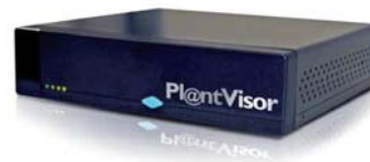
PlantVisor Embedded – специализированный компьютер с предустановленным PlantVisor

Автоматика Carel может быть интегрирована в SCADA систему стороннего производителя с помощью свободнораспространяемого OPC-сервера. Он позволяет передавать данные от контроллеров Carel в SCADA систему и обратно.