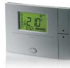
Бытовой пользовательский терминал rAD