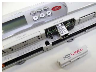
Carel pCOWeb – BACnet Ethernet шлюз для контроллеров семейства pCO

С точки зрения заказчика такая широкая номенклатура поддерживаемых протоколов является большим достоинством Carel. В случае использования внутреннего протокола производителя, для которого не существует «шлюза» — средства сопряжения со стандартным протоколом — заказчик оказывается «привязан» к оборудованию данного производителя. Это создает трудности для дальнейшего расширения системы.